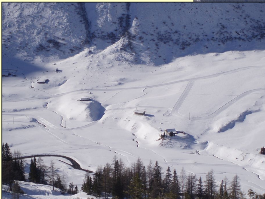
Baite in alta Valle di Gastein