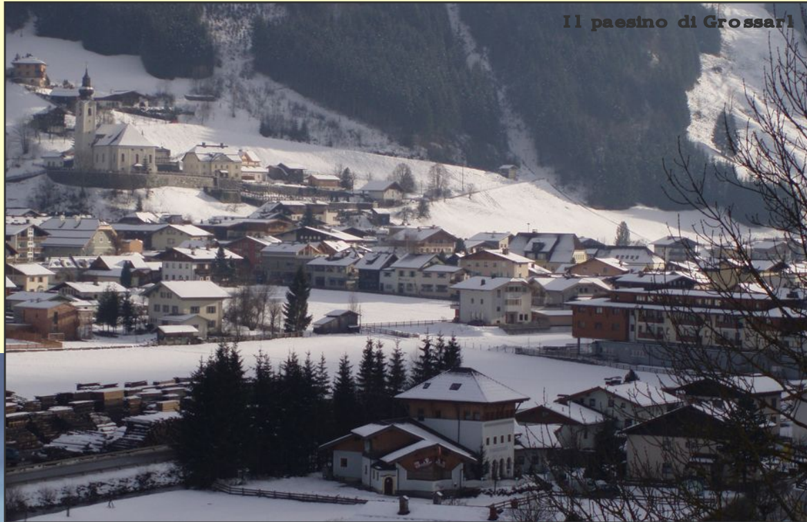
Il paesino di Grossarl

Le altre due località principali Bad Hofgastein e Dorfgastein, si trovano leggermente più a valle, intorno agli 800 metri di altitudine e sono facilmente raggiungibili sia da Salisburgo che da Monaco di Baviera.