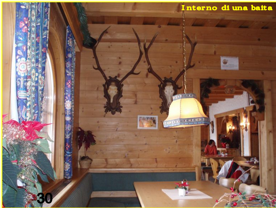
Interno di una baita

poco più di un'ora dal Valico del Tarvisio, un'esperienza certamente diversa rispetto alle montagne italiane, un'ulteriore occasione per confrontarsi con altre culture e comprendere nuove mentalità!