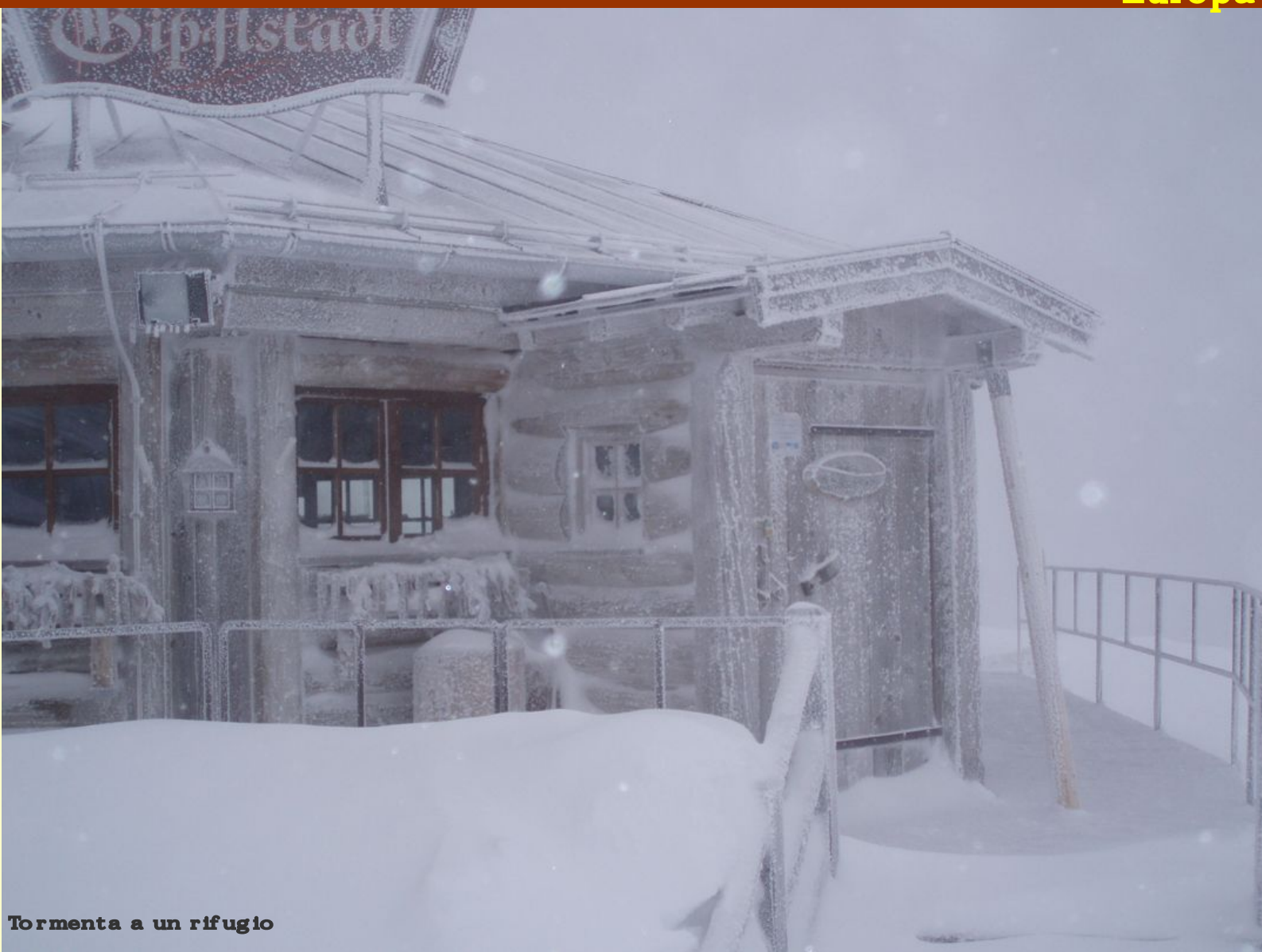
Tormenta a un rifugio

Inoltre la valle ha una doppia personalità: verde e rigogliosa in estate, con un bellissimo campo da golf, passeggiate e vie ferrate in quota; silenziosa sotto una coltre bianca di neve da novembre ad aprile, con impianti sciistici all'avanguardia e turisti provenienti da tutta Europa. Impareggiabili discese dalle alte cime fino a valle con dislivelli superiori a 1500 metri, attraversando boschi e rifugi, un'ospitalità regale e un'offerta turistica notevole; se poi siete amanti della gastronomia, allora lasciatevi tentare dalle tipiche "frittaten suppe" e dai piatti di "wurstel e kartoffeln", non ve ne pentirete!!