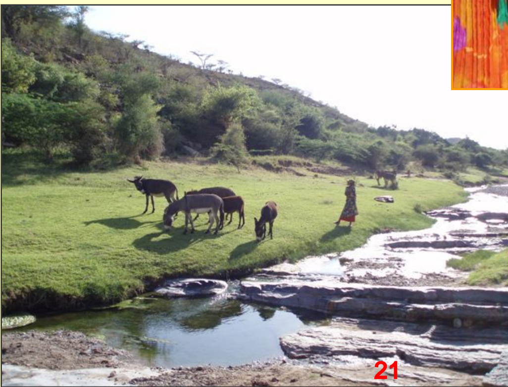
Asinelli al pascolo in una sorgente