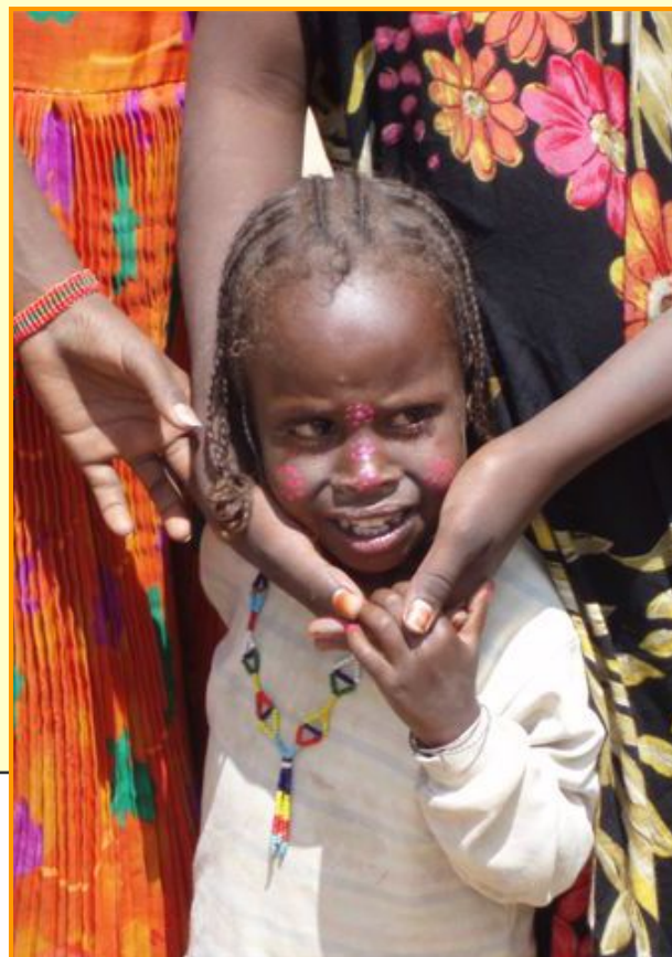
bambina di etnia Oromo

I bambini che prima fuggono impauriti alla vista di un "faranji", l'uomo bianco, e poi sorridono estasiati se ricevono anche semplicemente un biscotto o un mandarino; gli uomini che trascorrono le loro giornate sotto le acacie masticando "chat", foglie che danno una certa dipendenza, o