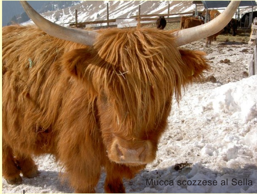
Mucca scozzese al Sella

Se volete mangiare dell'ottimo pesce il rifugio Emilio Comici (sul Piz Sella) è