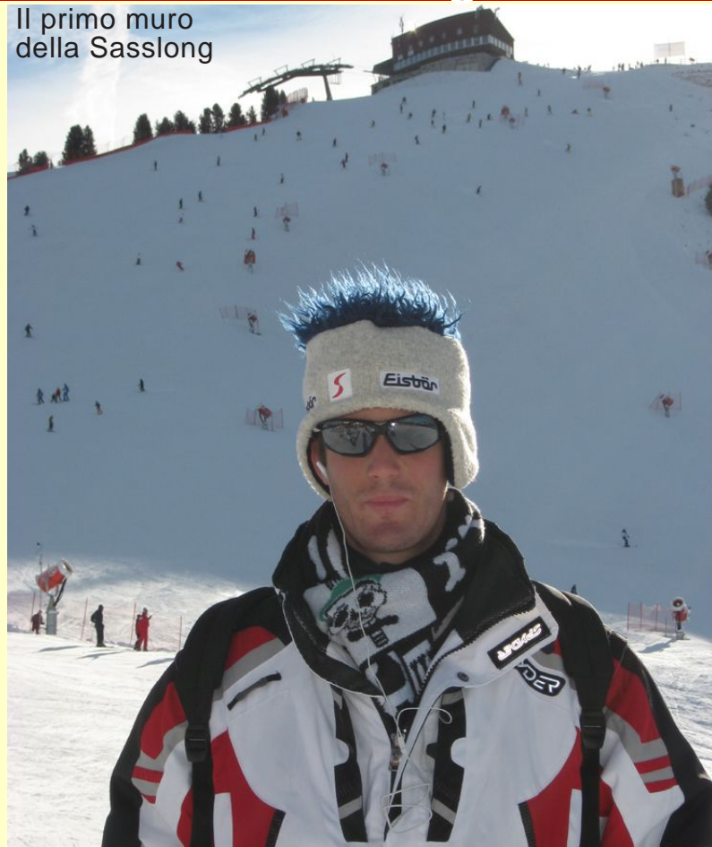
Il primo muro della Sasslong

in questa località? Vi state chiedendo quale pista? Ma la Sasslong ovvio.