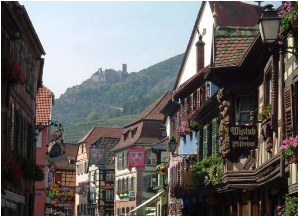
La Grand Rue di Ribeauville

centri della zona, è comodissimo da visitare per il viaggiatore, ampi parcheggi e i tipici paveè pedonali; lungo la "Grand Rue", la via principale, si incontrano gelaterie creperie e ristoranti, bellissime fontane e alberghi con architetture alsaziane ad intonaco rosso, azzurro...impossibile non trascorrerci almeno una notte, per ora Strasburgo può attendere!