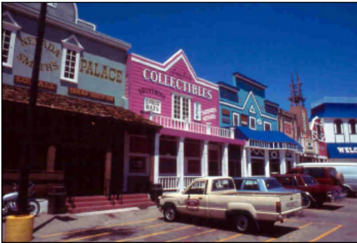
Paese nei pressi dell' Hoover Dam

Il bordo del South Rime, il più facilmente accessibile e quello in cui sono posti i punti panoramici più spettacolari, deve essere percorso in auto con continue deviazioni ai punti di osservazione, dove non si può rinunciare ad emozionanti escursioni a piedi, tra rocce multicolori, speroni, baratri, vegetazione, nuvole e incontri ravvicinati con le migliaia di scoiattoli e con i grossi cervi che popolano la zona.