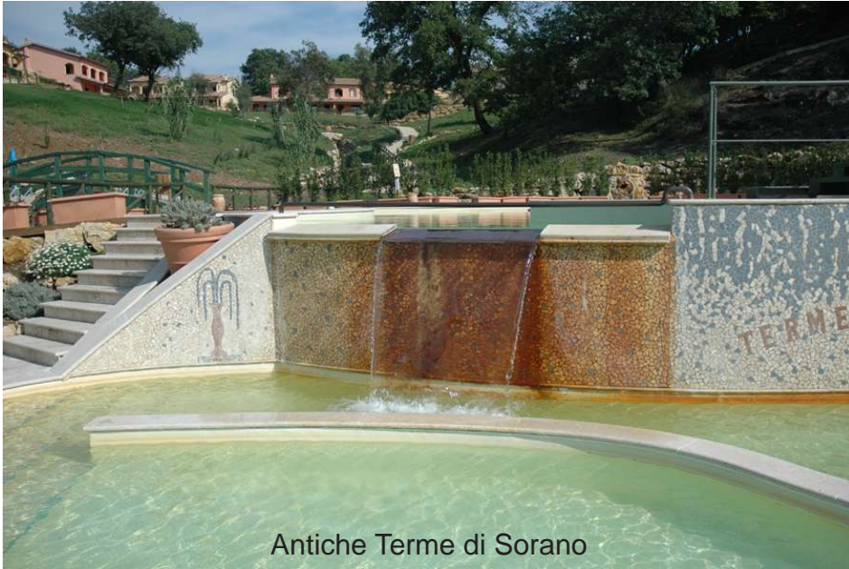
Antiche Terme di Sorano

Dopo la visita al borgo medievale arroccato su una rupe tufacea a picco sul Fiume Lente e dominato dalla quattrocentesca Fortezza Orsini, raggiungeremo le Antiche Terme di Sorano, a tre chilometri dal centro del paese.