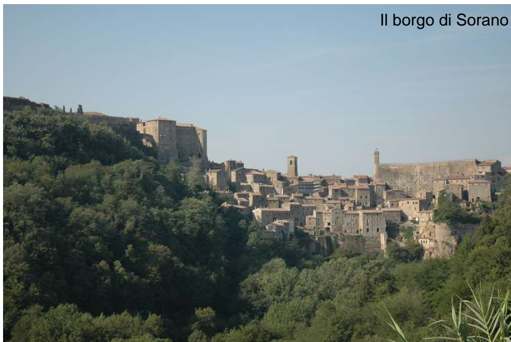
Il borgo di Sorano

Il pranzo sarà consumato alle Terme (se la giornata sarà soleggiata e tiepida sul bordo della piscina; altrimenti nel ristorante del centro termale) e sarà preparato tramite assaggi di prodotti alimentari locali come salumi maremmani e formaggi di Sorano, gustando gli splendidi vini della zona, come il Bianco di Pitigliano e il Morellino di Scansano.