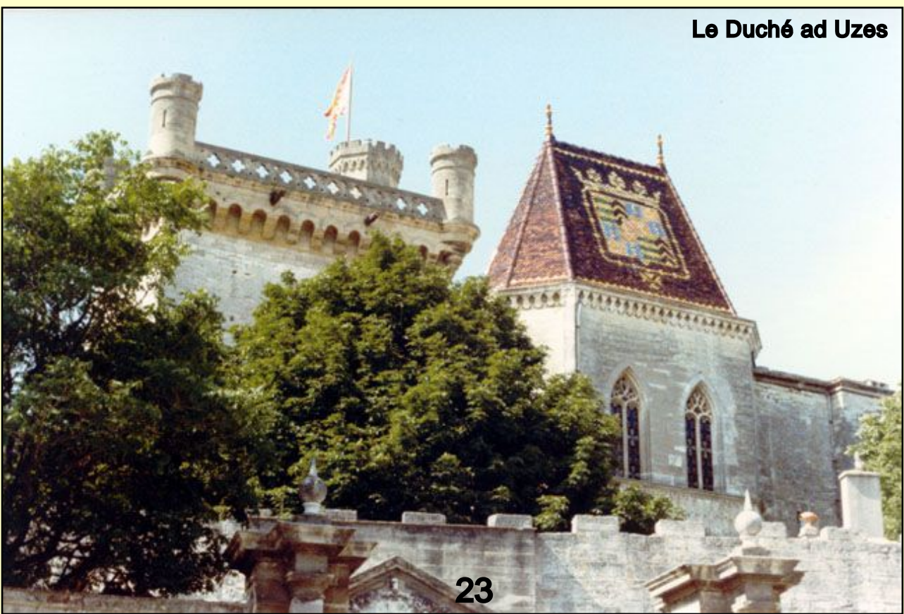
Le Duché ad Uzes