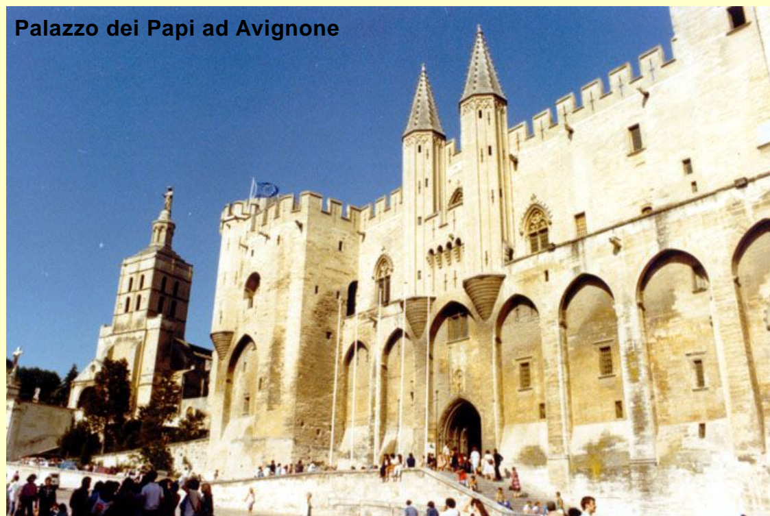
Palazzo dei Papi ad Avignone

intervalli per più di quindici anni cantando le più belle rime per l'amata Laura.