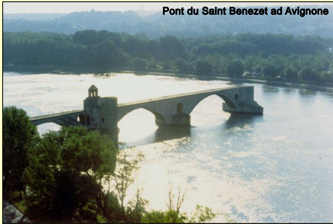
Pont du Saint Benezet ad Avignone

albergo moderno che contrasterà fortemente con il fascino antico del Clarion Hotel Cloitre St. Louis, dove avremo pernottato ad Avignone le due sere precedenti.