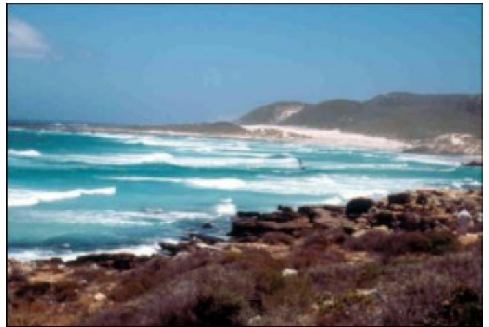
Le onde dell'Oceano Atlantico al Capo di Buona Speranza

Quanti anni ancora occorreranno per capire che le diversità sono fatte dai sentimenti e dalla mente dell'uomo e non dal colore della pelle e dalle razze?