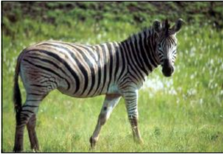
Gli splendidi animali del Sudafrica

La pubblicità turistica recita più o meno così "Tutto un continente in un'unica nazione", a voler significare la vastità (4 volte più grande dell'Italia) e la varietà del Sudafrica.