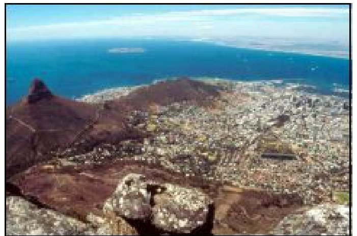
Cape Town dalla Montagna della Tavola

Infatti il Sudafrica è fatto di grandi spazi naturali, dove l'uomo si è limitato a ritoccare poche cose (utili e belle), come le strade per accedere e percorrere queste regioni o meravigliosi lodge dove soggiornare. Ma nelle vastità del Drakensberg, del Mpumalanga, del Namaqualand, del Kruger, dello Zululand comanda la natura, con le sue spettacolari formazioni geologiche, con i panorami sconfinati, con l'alternarsi della vegetazione e delle acque e con le migliaia di fantastici animali che ancora popolano queste regioni.