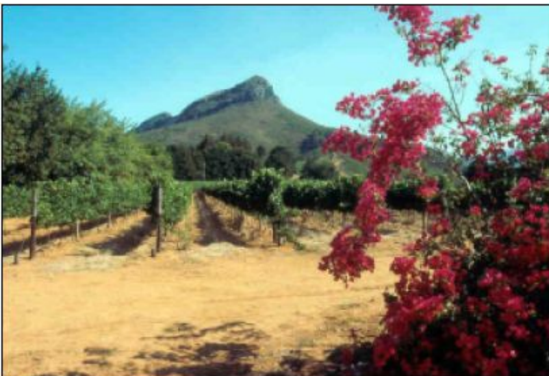
I vigneti di Stellenbosch

E che male fa vedere i lindi centri abitati, costituiti quasi sempre da ville bellissime, affiancati dalle baracche della popolazione nera, senza servizi, circondati da muri di segregazione, più simili a campi di detenzione che non a città.